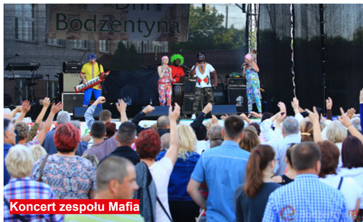
Koncert zespołu Mafia

Więcej informacji oraz fotografii z obchodów XXXIV Dni Bodzenty znajdują Państwo na stronie gminy: www.bodzenty.pl .