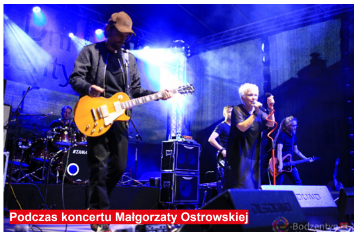
Podczas koncertu Małgorzaty Ostrowskiej

Gwiazdą wieczoru była Małgorzata Ostrowska z zespołem. Charyzmatyczna wokalistka od razu wystartowała swym mocnym głosem, a z każdym kolejnym utworem bodzentyńska publiczność coraz bardziej się rozkręcała.