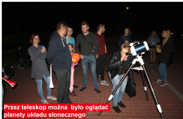
Przez teleskop można było oglądać planety układu słonecznego

Bodzenty i ościennych miejscowości, ale również turyści, którzy przybyli na wakacje do Gór Świętokrzyskich.