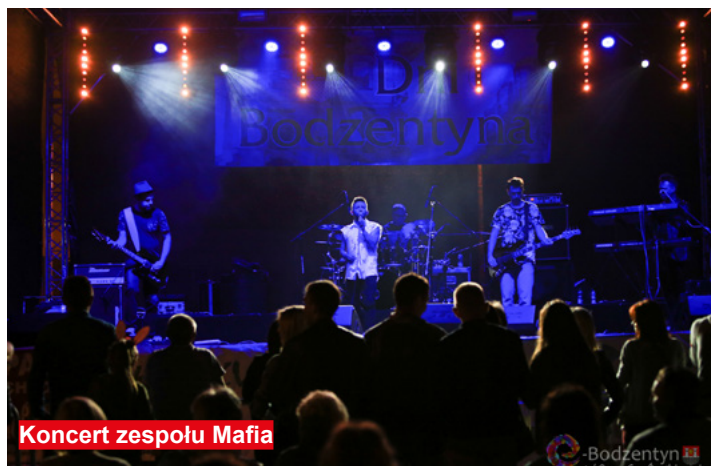
Koncert zespołu Mafia

Wytrwali widzowie mieli okazję potańczyć przy utworach grających przez zespoły: Mafia, Standard B, Strip czy Hypnos.