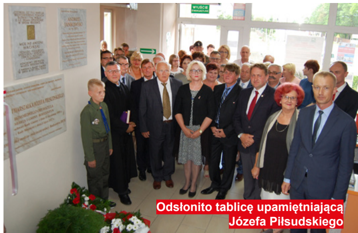
Odśloniono tablicę upamiętniającą Józefa Piłsudskiego

W związku z tymi uroczystościami w naszej gminie miały miej-