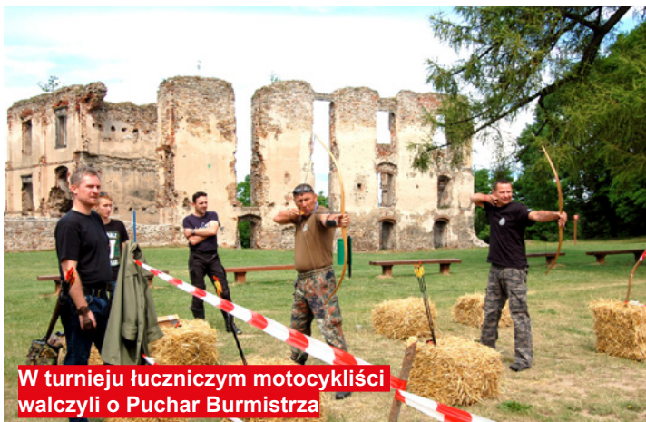
W turnieju łuczniczym motocykliści walczyli o Puchar Burmistrza

Rajd „Baba Jaga Tour” była pełną przygód propozycją dla spragnionych wrażeń motocyklistów, pragnących spędzić weekend na swoim pojeździe i na jednej z trzech przygotowanych przez Stowarzyszenie Motocyklowe CK Riders Kielce tras. Uczestnikami rajdu byli pasjonaci motocykli z całego kraju i nie tylko, albowiem gościliśmy również osoby z Argentyny, Hiszpanii i Anglii.