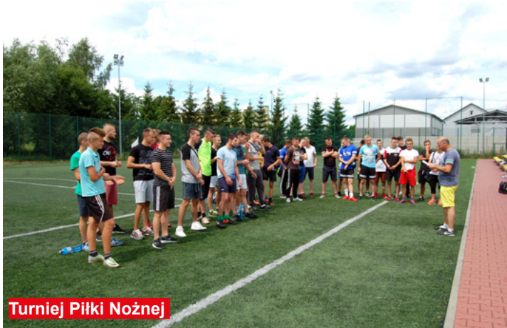
Turniej Piłki Nożnej