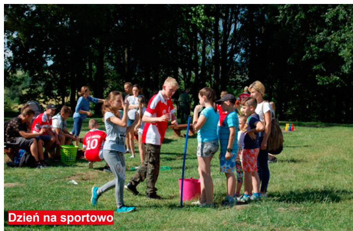
Dzień na sportowo

Również w sobotę na placu Pałacu Biskupów Krakowskich w godzinach popołudniowych odbył się Festyn Gier i Zabaw Sportowych dla dzieci i młodzieży. Na młodszych mieszkańców naszej gminy czekało aż 12 zabaw, gdzie za uzyskane 10 punktów każde dziecko otrzymywało medal sportowca!