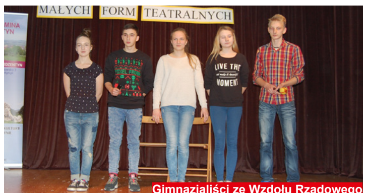
Gimnazjaliści ze Wzdole Rządowego