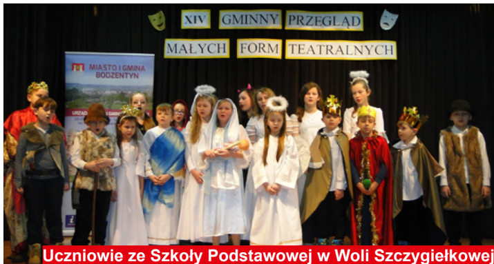
Uczniowie ze Szkoły Podstawowej w Woli Szczygiełkowej