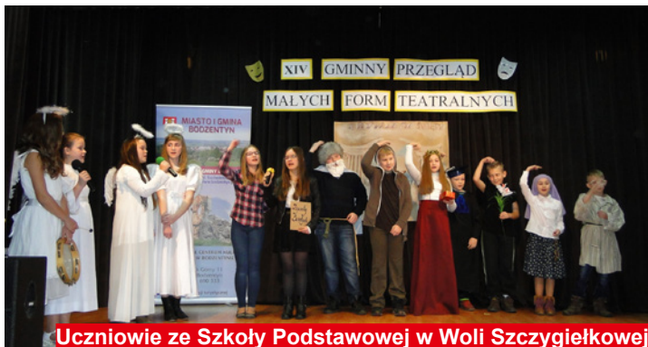
Uczniowie ze Szkoły Podstawowej w Woli Szczygiełkowej