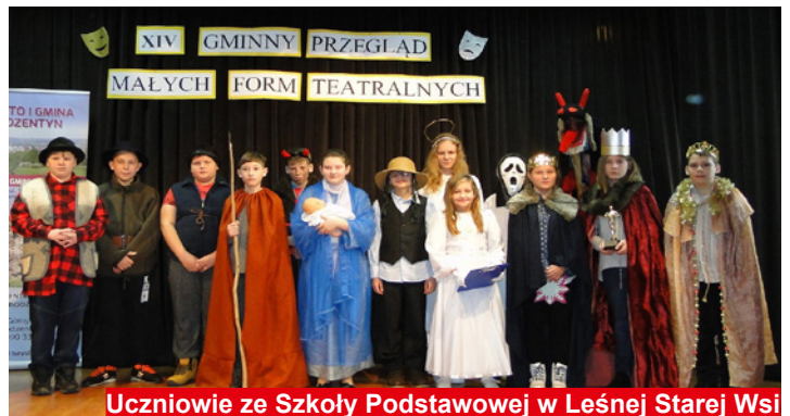
Uczniowie ze Szkoły Podstawowej w Leśnej Starej Wsi