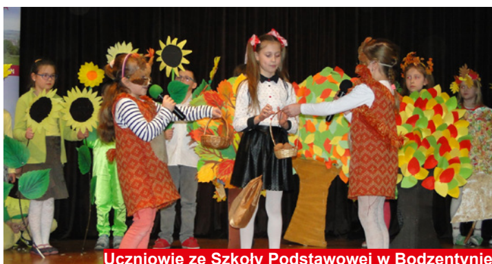
Uczniowie ze Szkoły Podstawowej w Bodzenty