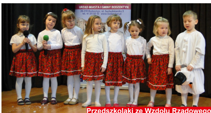
Przedszkolaki ze Wzdole Rządowego