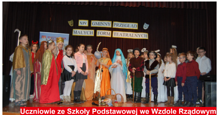
Uczniowie ze Szkoły Podstawowej we Wzdole Rządowym