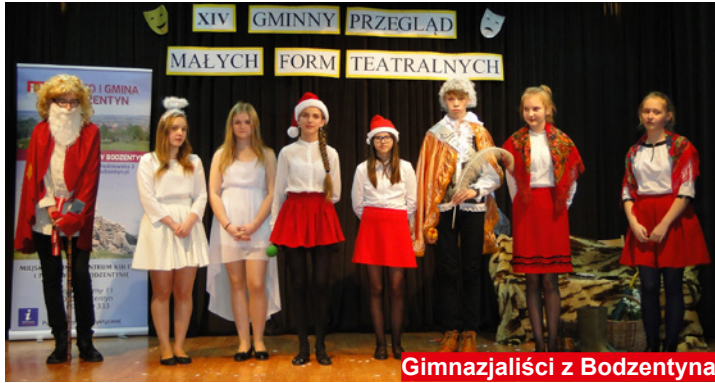
Gimnazjaliści z Bodzenty