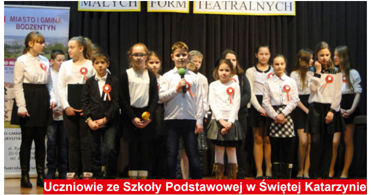
Uczniowie ze Szkoły Podstawowej w Świętej Katarzynie