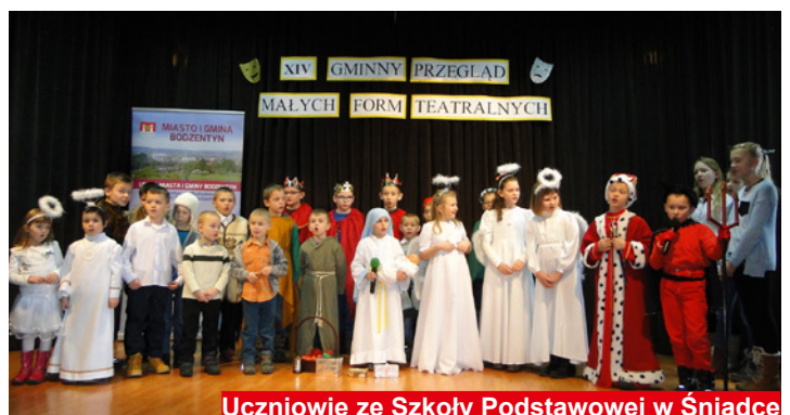
Uczniowie ze Szkoły Podstawowej w Śniadce