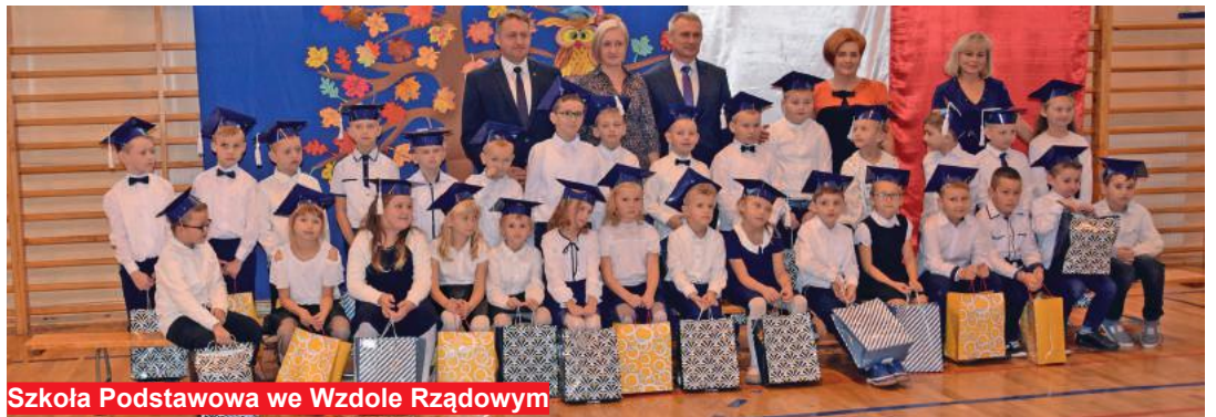
Szkoła Podstawowa we Wzdole Rządowym

Wszystkim Pierwszacom życzymy wielu sukcesów w dalszym zdobywaniu wiedzy.