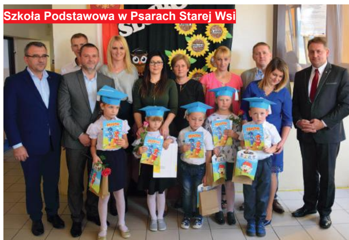
Szkoła Podstawowa w Psarach Starej Wsi