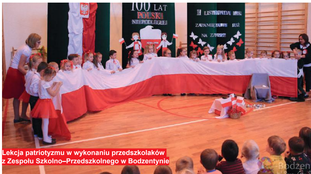
Lekcja patriotyzmu w wykonaniu przedszkolaków z Zespołu Szkolno-Przedszkolnego w Bodzentynie

Piękne przedstawienie z tej okazji zaprezentowały Przedszkolaki z Zespołu Szkolno – Przedszkolnego w Bodzentynie. 6-latkowie pod opieką swych nauczycielek przedstawiły niepowtarzalną lekcję historii. Dokładnie o godzinie 11:11 wszyscy zgromadzeni na sali, a w szczególności dzieci, odśpiewały cztery zwrotki Mazurka Dąbrowskiego na cześć 100. rocznicy Odzyskania Niepodległości w ramach akcji „Rekord dla Niepodległej”. Na sam koniec wszyscy uczniowie szkoły otrzymali specjalne zeszyty do języka polskiego z wizerunkiem Marszałka Józefa Piłsudskiego. Zapraszamy na fotorelację z tego przedstawienia. Warto podkreślić, iż w piątek, 9 listopada 2018 r. o godzinie 11:11, w ramach świętowania 100. rocznicy odzyskania przez Polskę niepodległości, dzieci