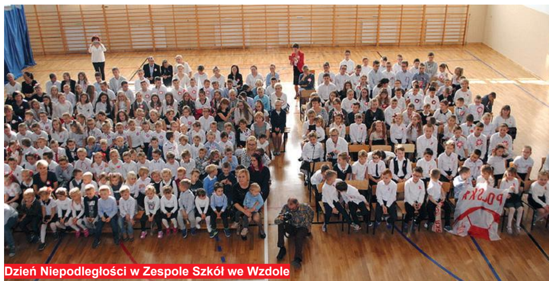
Dzień Niepodległości w Zespole Szkół we Wzdole