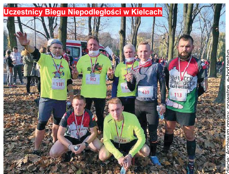
Uczestnicy Biegu Niepodległości w Kielcach