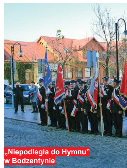
„Niepodległa do Hymnu” w Bodzentynie