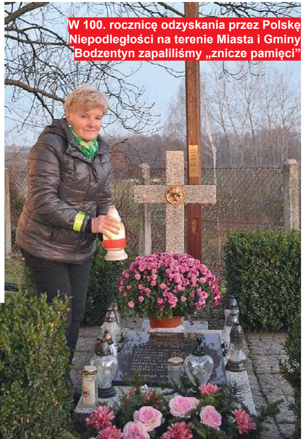
W 100. rocznicę odzyskania przez Polskę Niepodległości na terenie Miasta i Gminy Bodzentyn zapaliliśmy „znicze pamięci”