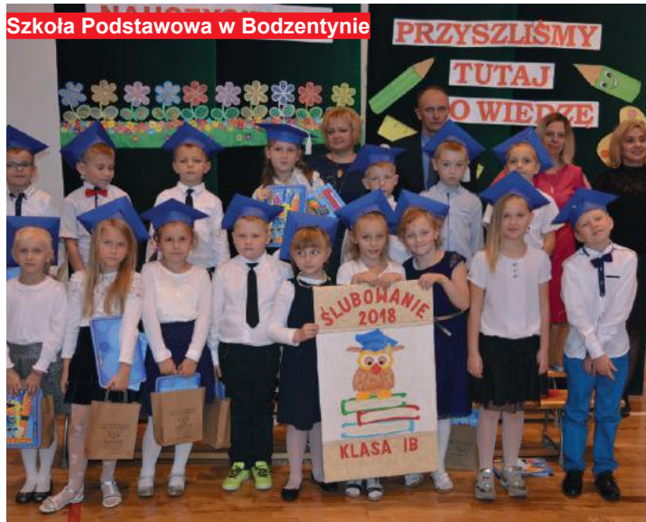
Szkoła Podstawowa w Bodzentynie