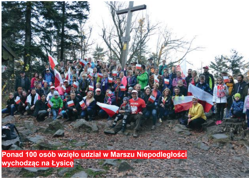
Ponad 100 osób wzięło udział w Marszu Niepodległości wychodząc na Łysicę

Warto pamiętać o tych i innych miejscach. To ważna część historii Państwa Polskiego. Zapalenie zniczy na w wielu wypadkach symbolicznych grobach walczących o Niepodległość Polski, to wyraz pamięci o tych, którzy zginęli w myśl dewizy: „Bóg, Honor i Ojczyzna”!