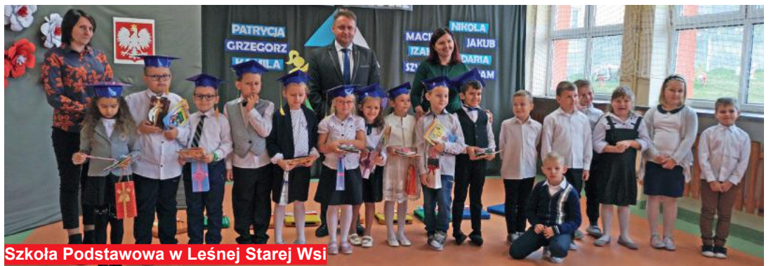
Szkoła Podstawowa w Leśnej Starej Wsi