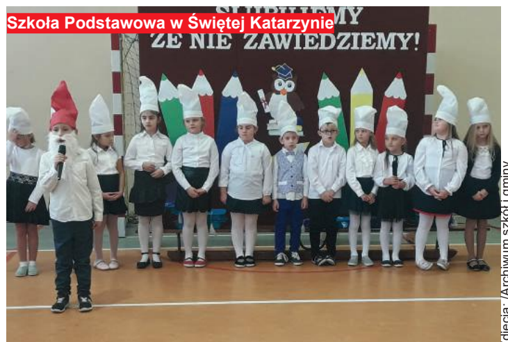
Szkoła Podstawowa w Świętej Katarzynie