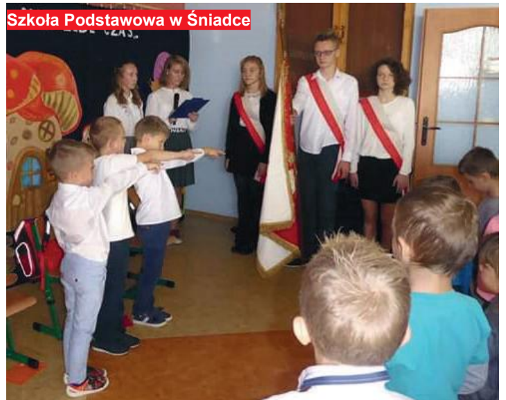
Szkoła Podstawowa w Śniadce