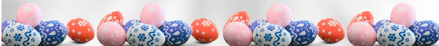
Renata Janik Wicemarszałek Województwa Świętokrzyskiego