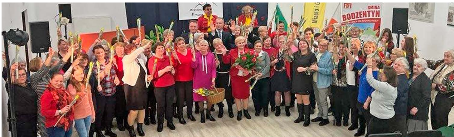
Zdjęcia BPICK w Bodzentynie