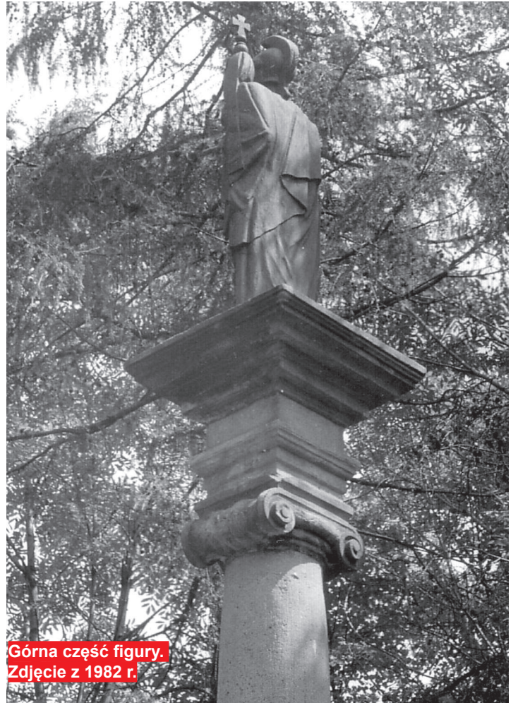
Górna część figury. Zdjęcie z 1982 r.

Kościół bodzencki 14 VIII 1791r przez okropną pogorzel miasta utracił dzwony cztery wartości 20 tys. złp. Masa pozostała jest tak uszkodzona, że nie będzie zdadną do przetopienia. Kościół przez lat kilkanaście pozostaje przy jednej sygnaturce /Arch. Parafii/