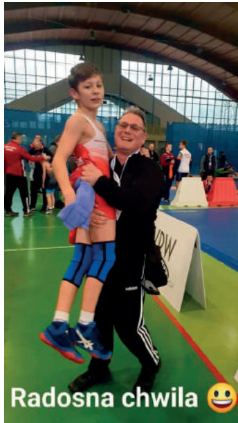
Radosna chwila 😊